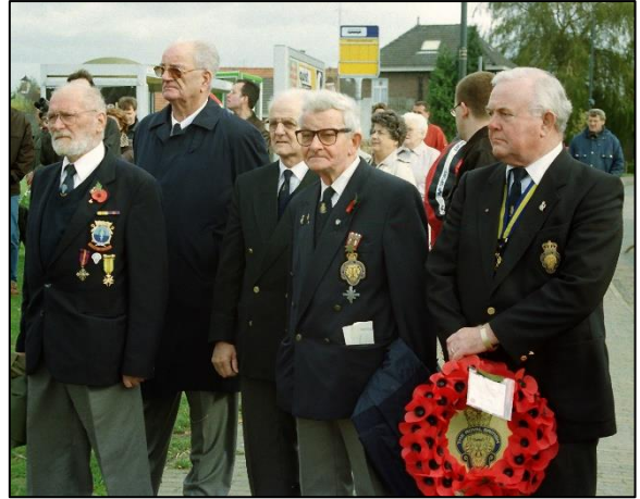
Veteranen bij de herdenking - 1998

In oktober 2019 vieren we 75 jaar Vrijheid: op 25 oktober 1944 is Moergestel bevrijd. Nu 75 jaar later leven er niet meer zoveel mensen die de bevrijding bewust hebben meegemaakt dan wel aanwezig waren aan de Reusel vlak bij het toenmalige St. Antoniusgasthuis. Noud Smits heeft in zijn boek "Moergestel 1940-1944 Oorlog en Bevrijding" een uitgebreid beeld geschetst van de jaren van oorlog en bevrijding. In de Jubileumuitgave van de Werkgroep Oorlog en Bevrijding Moergestel met de titel "Moergestel 60 jaar bevrijd 1944-2004" vertellen 8 inwoners over hun ervaringen in de oorlogsjaren. Geen van hen is nog in leven.