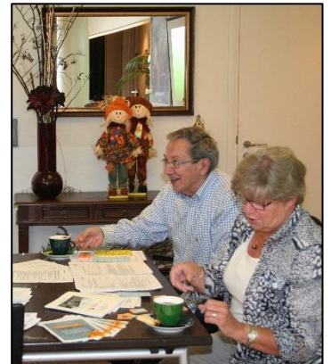
Open Dag Seniorenvereniging

We woonden in de Burg. van Heeswijkstraat schuin tegenover elkaar. Hun oudste dochter en onze oudste zoon speelden soms bij ons achter het huis in de zandbak.